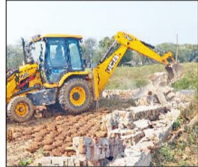
रेवाड़ी। अवैध कॉलोनी का निर्माण तोड़ती जेसीबी।

डीटीपी विभाग की टीम ने शुक्रवार को बावल क्षेत्र में रेवाड़ी-शाहजहांपुर रोड और रेवाड़ी-बावल रोड की राजस्व सीमा में अवैध रूप से विकसित की जा रही दो कॉलोनियों व अवैध निर्माणों पर एक्शन लिया। पुलिसबल की मौजूदगी में डीटीपी की कार्रवाई का कर्तव्य नहीं हुआ। डीटीपी की लगातार कार्रवाई के बाद भी कॉलोनाइजर व डीलर नई कॉलोनियां विकसित करने में लगे हुए हैं। डीटीपी के निर्देश पर शुक्रवार