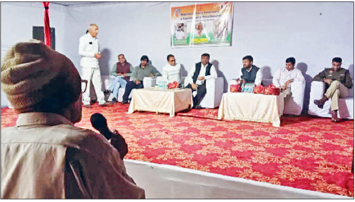
रेवाड़ी। रात्रि ठहराव कार्यक्रम में लोगों की समस्या सुनते अधिकारी।