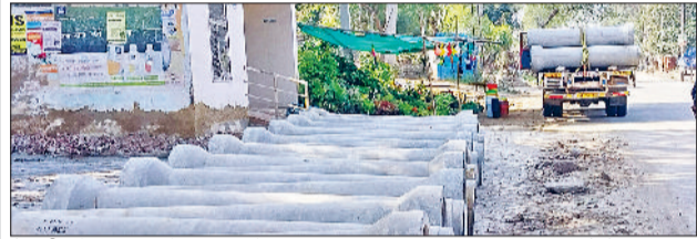
रेवाड़ी। नेहरू पार्क के पास डाले गए पाइप।

शहर में बारिश के दौरान जलभराव की समस्या से निजात दिलाने के लिए स्टॉर्म वाटर प्रोजेक्ट के पहले चरण के तहत अंडरग्राउंड पाइप लाइन डालने का कार्य तेजी से किया जा रहा है। इस परियोजना पर 26 करोड़ रुपये खर्च किए जा रहे हैं, जिसमें दो नए मेन पाइप स्टेशन बनाए जाएंगे तथा एक पुराने पाइप स्टेशन को अपग्रेड किया जाएगा। अनाजमंडी रोड पर चेंबर बनाने के साथ सड़क के किनारे-किनारे पाइपलाइन बिछाने का कार्य किया जा रहा है। इस पाइपलाइन से केवल बरसात के पानी की ही निकासी होगी। प्रोजेक्ट के पूरा होने के बाद शहर के आधे से अधिक हिस्से में जलभराव की समस्या दूर होगी।