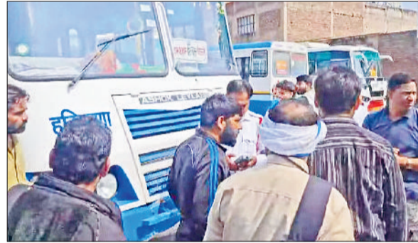
रेवाड़ी। पुलिस की ओर से इंपाउंड की गई रोडवेज, चालान काटते हुए ट्रैफिक पुलिस।

रोडवेज में लीज पर चल रही एक बस का चालक प्राइवेट बस चालक के साथ उलझ गया। विवाद होने पर मौके पर ट्रैफिक पुलिस पहुंच गई। एल्कोहल मीटर ने उसके शराब के नशे में होने की पुष्टि कर दी। चालक के पास बस के दस्तावेज पूरे नहीं होने के कारण पुलिस ने बस को इंपाउंड कर दिया। यात्रियों को दूसरी बस से दिल्ली के लिए रवाना किया गया। काफी देर तक बस यात्रियों को परेशानी का सामना करना पड़ा। राजस्थान के सरदार शहर से वाया