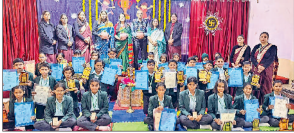
रेवाड़ी। कार्यक्रम में मौजूद स्कूली बच्चे, स्टाफ सदस्य व गेस्ट।