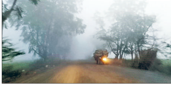
रेवाड़ी। शुक्रवार सुबह महेन्द्रगढ़ रोड पर छाया कोहरा।

नहीं आ रही है। शुक्रवार सुबह आसमान साफ रहने के बावजूद घना कोहरा छाया रहा। कोहरे के कारण सड़कों पर वाहनों की रफ्तार धीमी पड़ी रही। वाहन चालक लाइटें जलाकर एक-दूसरे के पीछे चलते नजर आए। हालांकि कोहरे की विजिबिलिटी ज्यादा खराब नहीं थी, परंतु हाइवे पर इसका ज्यादा असर रहा। सुबह के समय मौसम ठंडा बना रहा। 9 बजे तक तेज धूप निकलते ही कोहरा साफ हो गया। इसके बाद मौसम गर्म होना शुरू हो गया। अधिकतम तापमान 0.5 डिग्री सेल्सियस बढ़कर 27.0 डिग्री पर