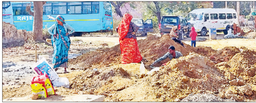
रेवाड़ी। अनाजमंडी रोड पर चेंबर बनाते कारीगर।

खासतौर पर ब्रास मार्केट, बावल रोड, मांडल टाउन, बस स्टैंड के आसपास, नाईवाली चौक, नई आबादी और उससे जुड़े इलाकों की बड़ी आबादी को राहत मिलेगी। इन क्षेत्रों में बारिश का पानी कई दिनों तक सड़कों पर भरा रहता है। स्टॉर्म वाटर प्रोजेक्ट के तहत दो नए पाइप स्टेशन बनाए जाएंगे। पहला बावल रोड पर नाले के पास नगर परिषद की जमीन पर बनेगा। दूसरा पाइप स्टेशन नई आबादी के पीछे रेलवे लाइन के पास बनाया जाएगा। इसके लिए रेलवे से 10 वर्ष की अवधि के लिए जमीन लीज पर ली गई है। करीब 35 लाख रुपये की राशि ट्रांसफर की जा चुकी है। इसके अलावा नयागांव के पास पहले से बने मेन पाइप स्टेशन की पुरानी मशीनरी को अपग्रेड किया जाएगा।