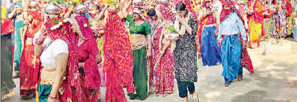
नांगल चौधरी। हिंदू सम्मेलन में कलश यात्रा निकालती महिलाएं।

बढ़ रहा है। स्कूल व कॉलेज के विद्यार्थियों तक नशे की पकड़ पहुंच गई। जिससे सामाजिक स्वरूप बिगड़ने का खतरा उत्पन्न हो गया। समाधान के लिए पुलिस और आमनागरिकों को तालमेल बनाकर कार्रवाई को अंजाम देना जरूरी है। गांवों में नशा मुक्ति