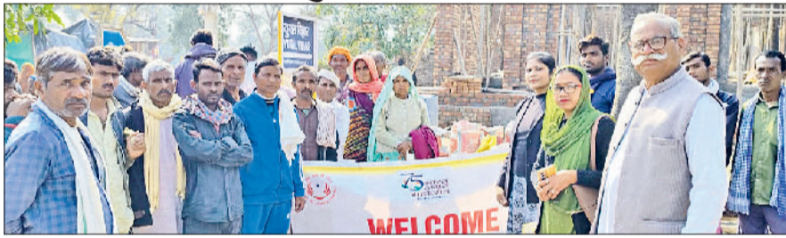
रेवाड़ी। लोगों को कानूनी जानकारी देते हुए अधिवक्ता।